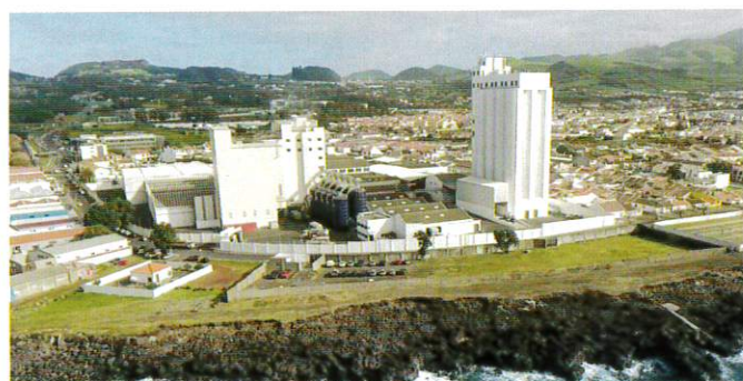
Em 50 anos a evolução das indústrias foi enorme. À esquerda uma unidade com 55 anos. Em cima o exterior de uma fábrica moderna